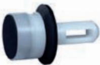
Art. 8G12-6 Stößel Dichtungskit