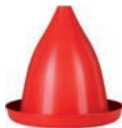
Art. 36-T Hängetränke Behälter