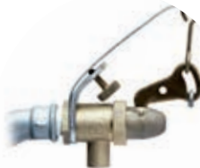
Art. 6A Blattfeder Ersatzventil