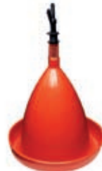
Art. 36- Ersatzbehälter